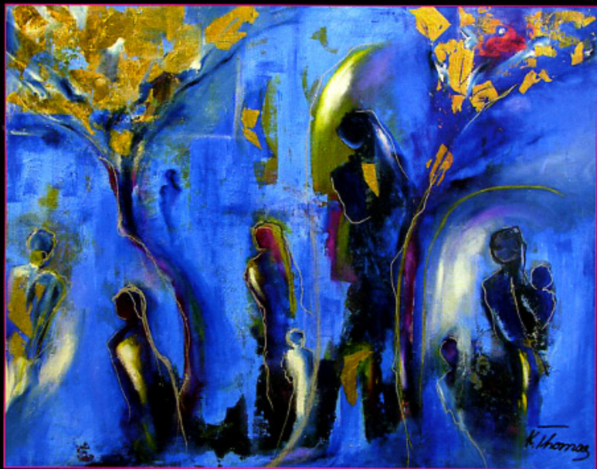
"L'albero della vita" tecnica mista di olio pigmenti e polveri di metalli preziosi su tela cm. 80x100

Spazi, i suoi, nutriti da corposi pigmenti, dai quali emergono potentemente i colori impreziositi di porpora e di blu co-