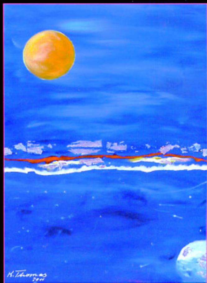
"Il quarto giorno della creazione" olio e pigmenti su tela cm. 80x60

Tecnica pittorica, la sua, il cui stile rappresentativo, del tutto personale, fa dell'Autrice un'autentica protagonista dell'Arte contemporanea è destinata ad esserne valida testimone e colta interprete.